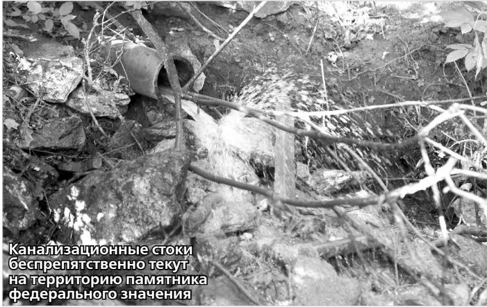
Канализационные стоки беспрепятственно текут на территорию памятника федерального значения