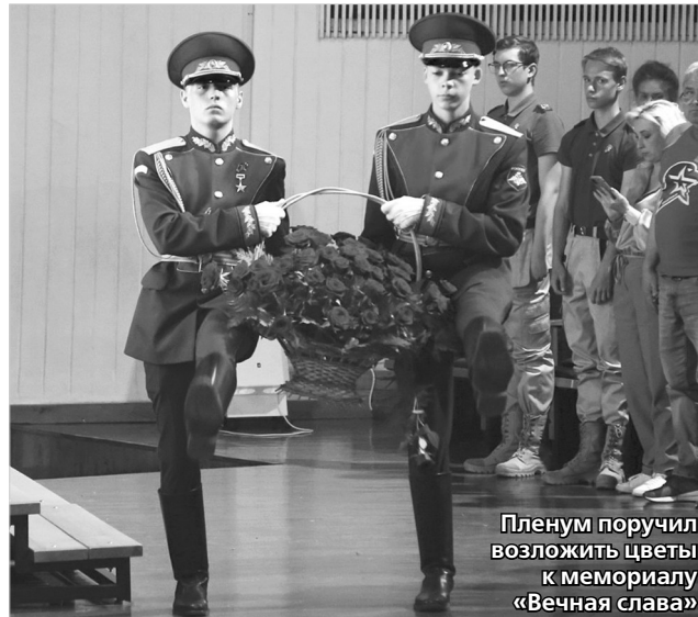
Пленум поручил возложить цветы к мемориалу «Вечная слава»

И напомнил всем нам вот такие цифры: сейчас в городе Ставрополе проживают 79 участников Великой Отечественной войны, 526 тружеников тыла, 4178 ветеранов военной