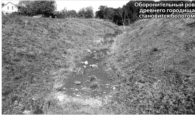
Оборонительный ров древнего городища становится болотом

В минувший четверг по инициативе Ставропольского отделения Всероссийского общества охраны памятников истории и культуры на Татарском городище состоялась пресс-конференция.